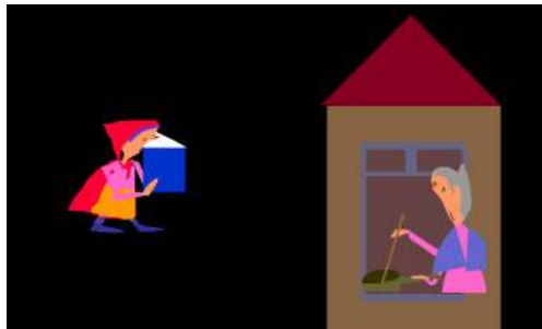
A Interminável Chapeuzinho , de Ângela Lago Ilustração 3

Nessa obra, disponível no site , os recursos hipertextuais são explorados de forma lúdica e colorida, permitindo-nos observar muitas características apontadas por Lúcia Santaella a respeito da leitura hipermidiática. Uma delas é o caráter volátil do texto em que, o leitor ao embrenhar-se nas redes perceberá a importância e autonomia das partes que formam essas cadeias de percursos.